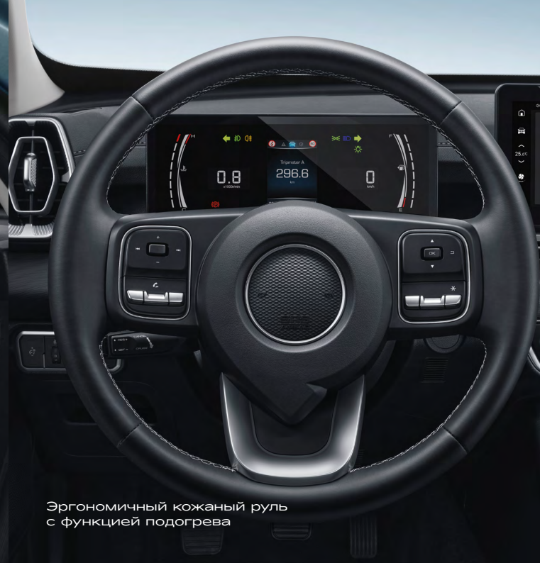
Эргономичный кожаный руль с функцией подогрева