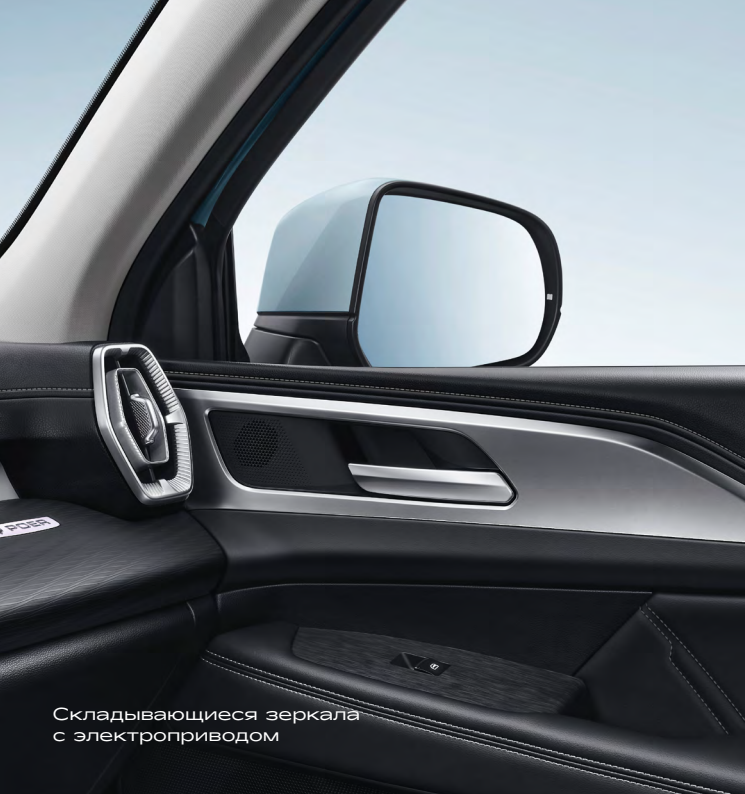
Складывающиеся зеркала с электроприводом