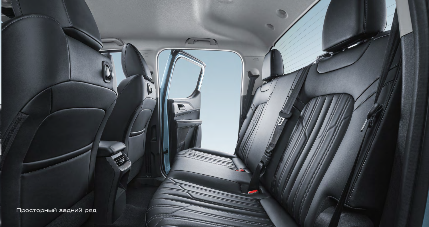
Просторный задний ряд